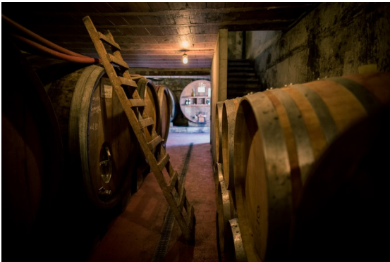
Les barriques et les foudres de la cave de la Machotte